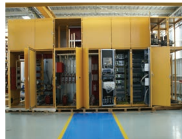
Simon Bolivar, Venezuela THYNE6-Erregungssystem für Höchstspannungsebene Kraftwerksleistung: 6x 805 MVA