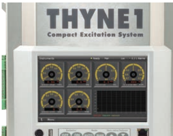
Kleinwasserkraftmarkt THYNE1-Kompakterregungssystem speziell für den Einsatz in Kleinwasserkraftwerken