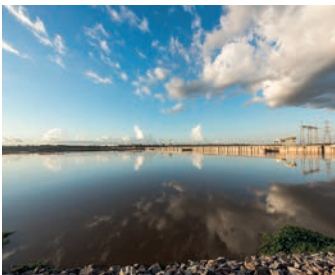
Santo Antonio, Brasilien gesamtes Automatisierungssystem für eines der größten Wasserkraftwerke in Brasilien

6 x 550 MW; Zum Leistungsumfang gehört die Demontage des alten Systems sowie die Planung, Konstruktion, Installation und Inbetriebnahme des neuen Systems. Die Lösung umfasst ein redundantes SCADA-System an zwei Standorten und 13 verteilte lokale Leitstände