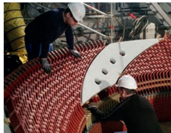
Langenprozelten, Deutschland HIPASE-E-Erregung für den weltweit größten Einphasengenerator Kraftwerksleistung: 2x 94 MW